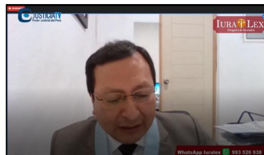
JUSTICIA TV: Audiencia Virtual de Crimen Organizado.