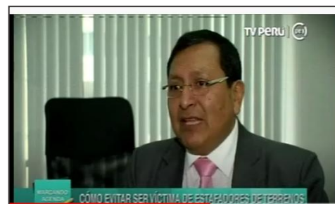
TV PERÚ: Tráfico de terreno.