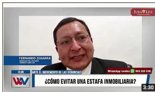
WILAX TV: ¿Cómo evitar una estafa inmobiliaria?