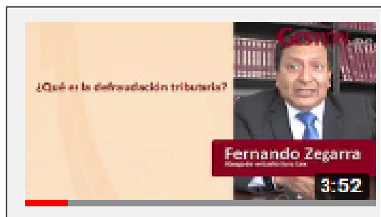
GESTIÓN: Defraudación Tributaria.