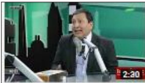
CAPITAL: Que hacer antes de alquilar una vivienda o local comercial.