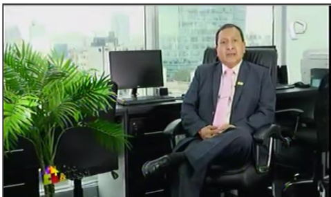
PANAMERICANA: Consejos legales antes de adquirir un inmueble.