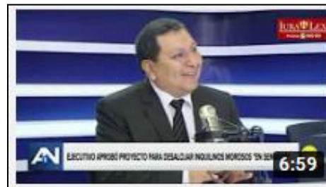
RPP NOTICIAS: Nueva Ley para desalojar inquilinos morosos.