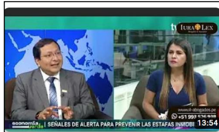
TV PERÚ: Evite caer en estafas inmobiliarias.