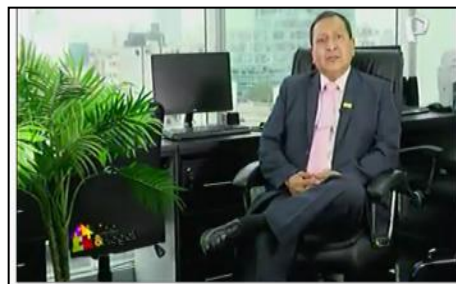
CASAS & IDEAS: Consejos para comprar un inmueble.