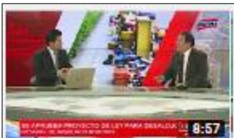
EXITOSA: Desalojo Notarial, nueva Ley permitirá desalojar inquilinos rebeldes.