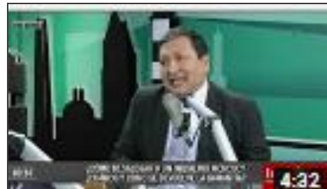
CAPITAL: Como encontrar un buen inquilino.