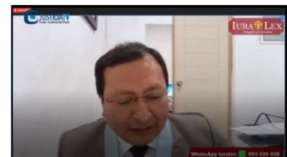
JUSTICIA TV: Audiencia Virtual de Crimen Organizado.