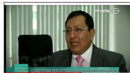
TV PERÚ: Tráfico de terreno.