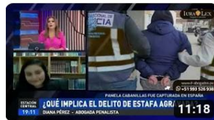
ATV +: ¿Qué implica el delito de estafa agravada?