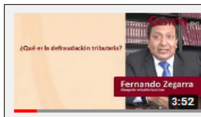
GESTIÓN: Defraudación Tributaria.