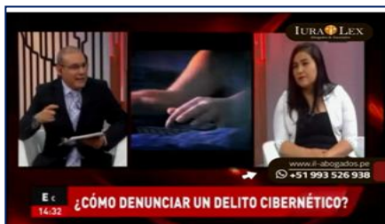
EN CONTACTO: ¿Cómo denunciar un delito cibernético?