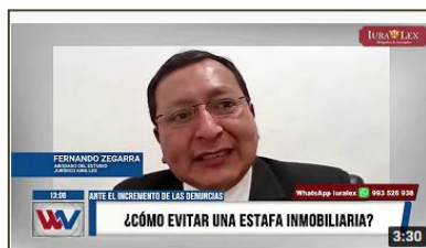
WILAX TV: ¿Cómo evitar una estafa inmobiliaria?